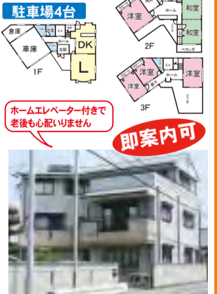
鉄骨造3階建、前面道路東側12m