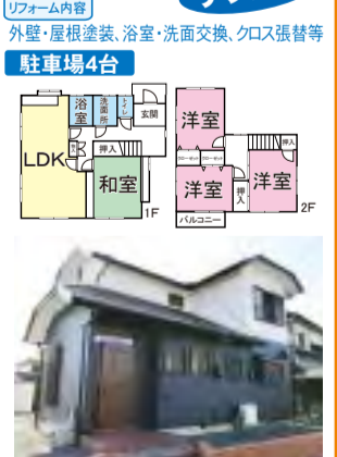
駐車場4台、充実のリフォーム内容