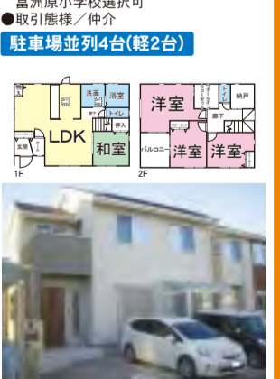
スマト住宅(太陽光3.15kw、EV充電)築約3年