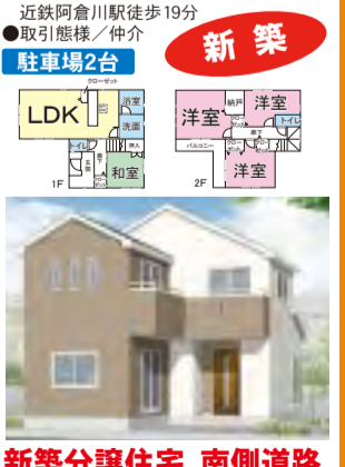
新築分譲住宅、南側道路、海蔵小学校区、建築中