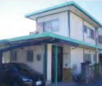
海蔵小学校・山手中学校・駅・スーパー・病院徒歩圏内